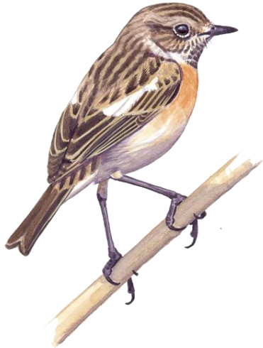
© Kókay Szabolcs - MME - www.mme.hu