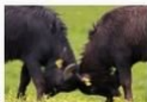
Kápolnapuszta Bivalyrezervátum, Kis- Balaton