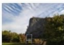
Hegyes-tű Geológiai Bemutatóhely, Monoszló

Novemberben is várunk mindenkit gyalogos -, kenus - és e-kerékpáros programjainkra. Bemutatóhelyeink téli nyitvatartásáról tájékozódjanak honlapunkon IDE vagy az alábbi képre kattintva.