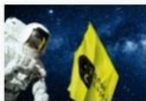
Pannon Csillagda, Bakonybél