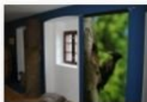
Erdők Háza, Bakonybél