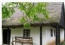
Vörösi Tájház, Kis-Balaton