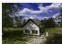
Fekete István-emlékhely, Kis-Balaton / Fenékpuszta / Diás-sziget