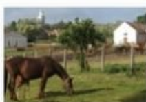
Salföldi Major, Salföld