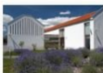
Levendula Ház Látogatóközpont, Tihany