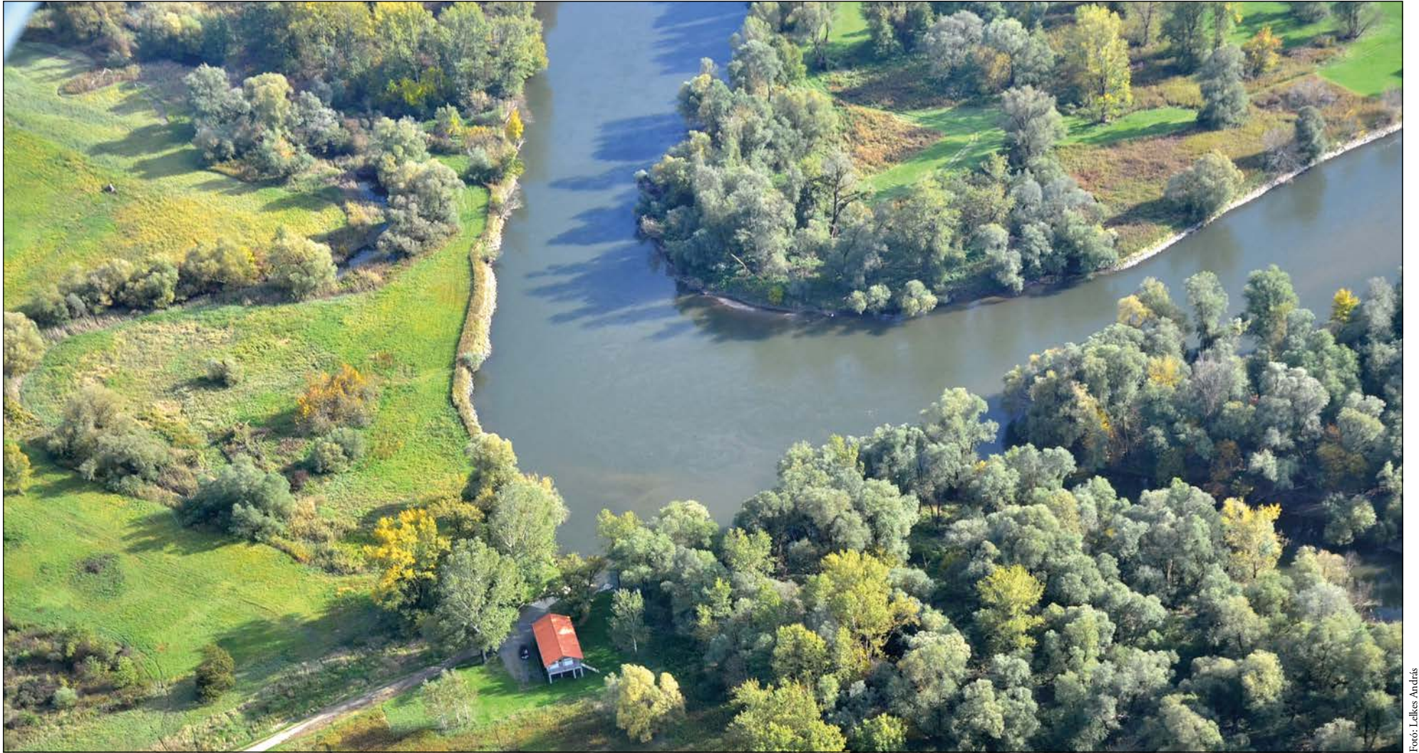
Alsószerénye, Mura-kanyar a Hódvár Vízitúra Kikötővel