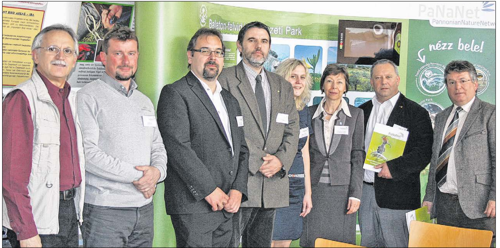
2014 márciusában a projektpartnerek az illmichi nemzeti parki információs központban értékelték a hálózati együttműködés öt esztendejét.

Ténylegesen a hatásmechanizmusok két szintjét kell szem előtt tartanunk, ha a PaNaNet 2008–2014 eredményeit meg szeretnénk ítélni. Egyrészt azt, amelyet az összes tervezett tevékenység megvalósításával sikerült elérni, a közös PR-tevékenységtől kezdve a képzési programokon keresztül a természeti turizmus infrastruktúrájáig. Másrészt azt, ami a védett területek természetvédelmi menedzsmentjével foglalkozó határon átnyúló csapat létrejöttéhez vezetett, melynek központi célkitűzése a