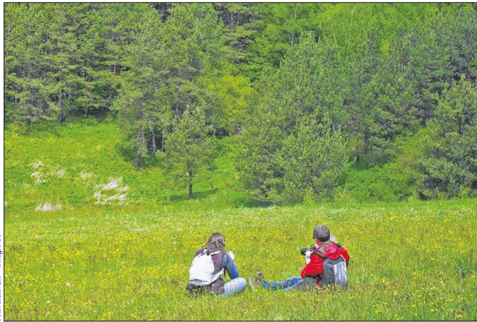
Az Őrségi Nemzeti Park természeti környezete egyedülálló kikapcsolódási lehetőséget biztosít nem csak az orchideákat „vadászó” természetfotósoknak.

amelyek alkalmasak a hosszabb távú megfigyelésre és/vagy a természetfotózásra. Hogy a különböző évszakokban melyik élőhelyen milyen látnivaló akad, azt az Illmicben található, egész évben nyitva tartó információs központban tudhatják