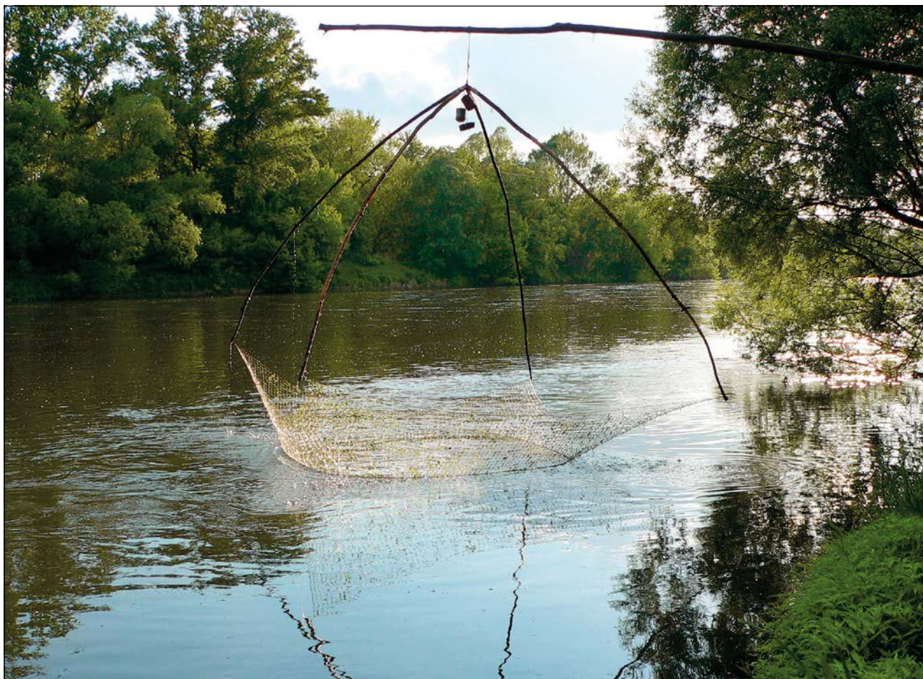
Akinek szerencséje van, a folyóparton az emelőhálós halászat rejtelmével is megismerkedhet

szakasza, s jellemzően annak is a bal partja tartozik Magyarországhoz, ám természetvédelmi szempontból jelentősége felbecsülhetetlen. Maga a folyó rendkívül gyors sodrású, a medrét kavics borítja, a kilométerenkénti 30-35 centiméteres esése pedig kifejezetten nagynak számít. A természetvédelmi örösszehasonlításként megemlíti, hogy az Alföldön a Tisza esése mindössze fél-egy centiméteres, míg a