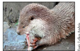
Lencsevéken az óvatos vidra, mely zsákmányát fogyasztja éppen

gazdálkodási formák alakultak ki, itt a halászatnak és a legeltető állattartásnak volt jelentősége, míg az erdőgazdálkodás kiegészítő tevékenységnek számított.