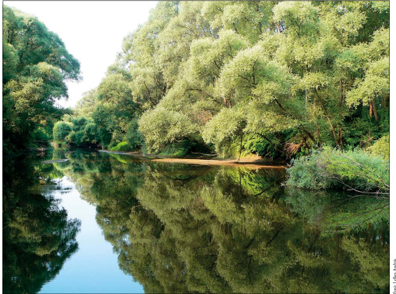
Egy murai vízitúra ilyen emlékekkel ajándékozta meg az embert