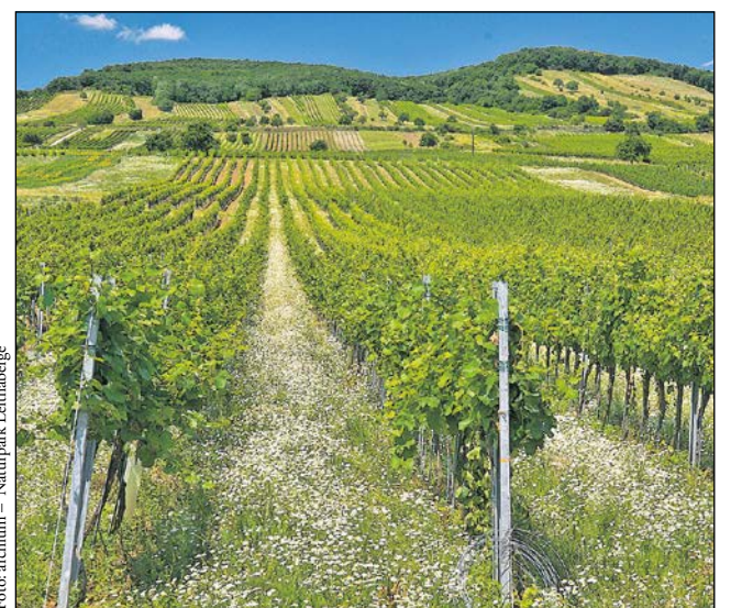
A Fertő tó nyugati partján a kultúrtáj a nádgyűrűtől a Lajta-hegységig terjed.