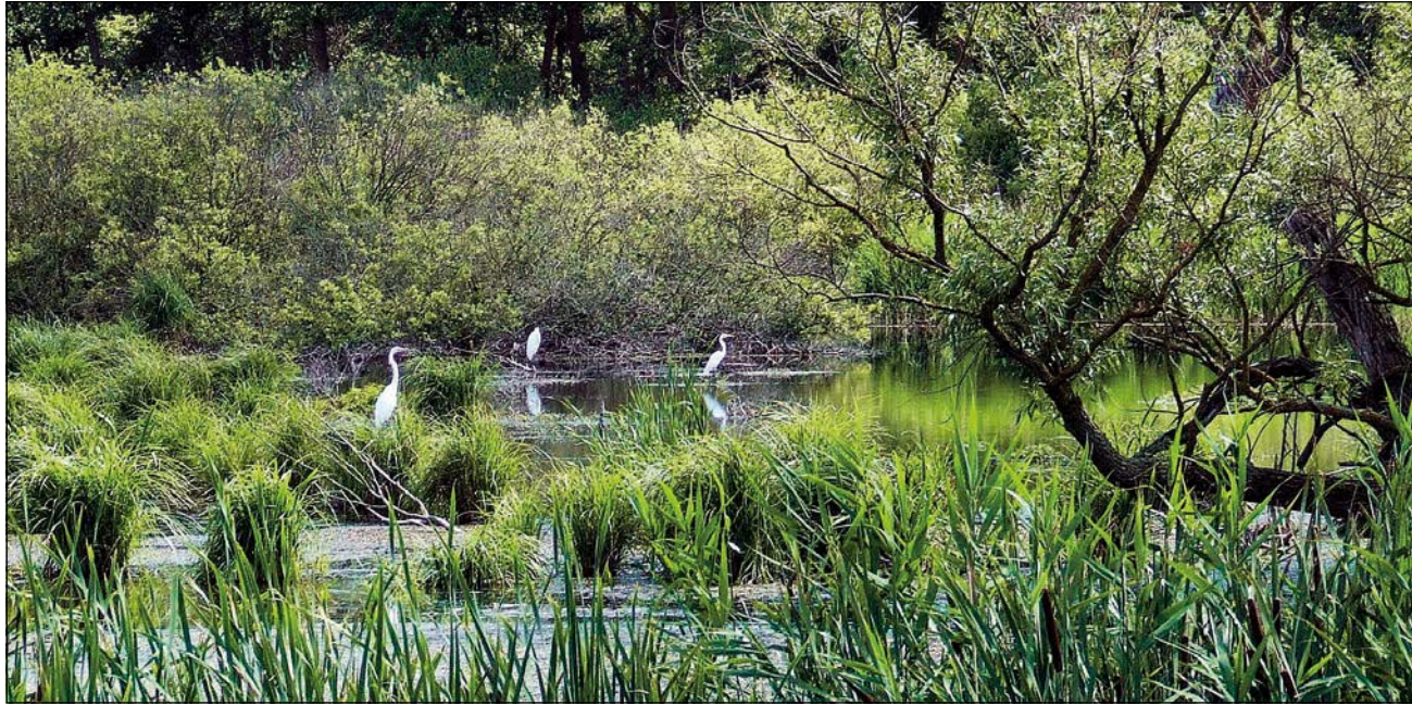
Kis kócsag eredményes vadászat után. A Kis-Balaton a vízi madarak paradicsoma