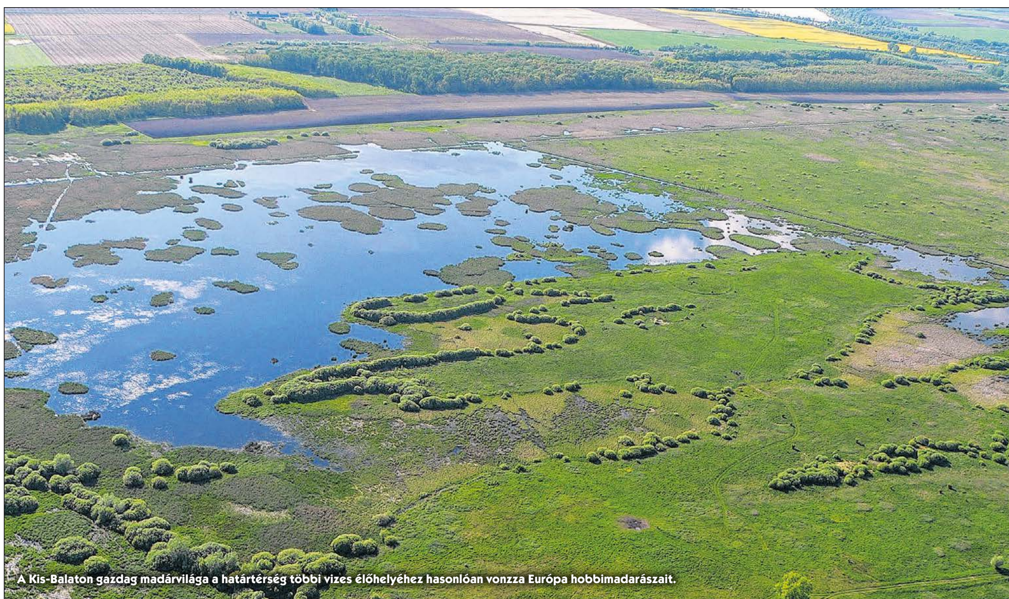
A Kis-Balaton gazdag madárvilága a határtérség többi vizes élőhelyéhez hasonlóan vonzza Európa hobbimadarászait.