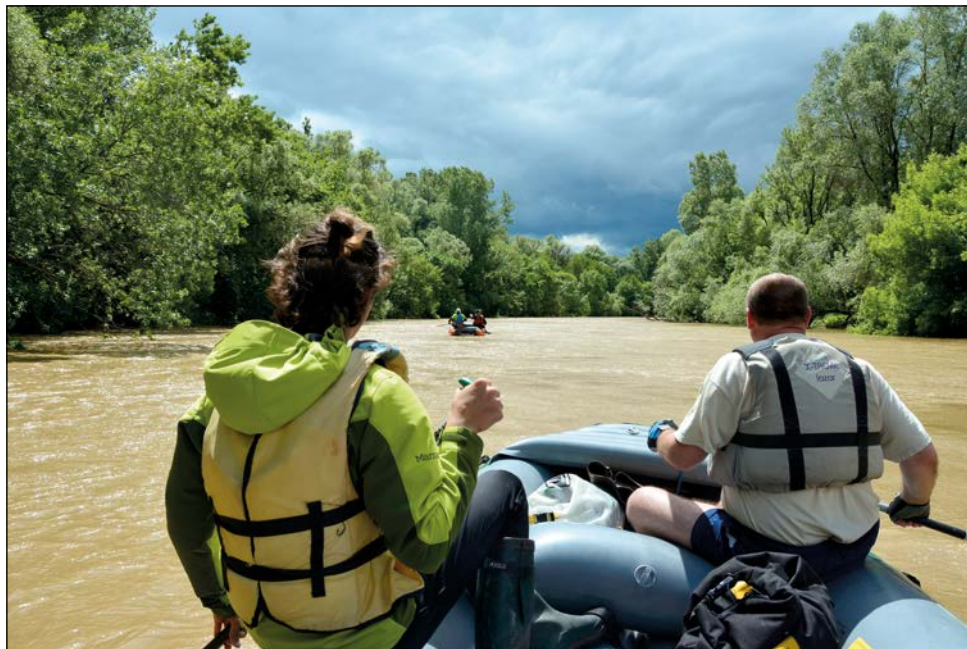
Vízitúra a Murán. Megismertet a természet szépségével, erejével - és önmagunkkal