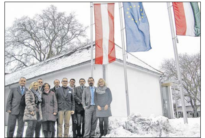
2017 januárjában a dél-burgenlandi Beleden (Bildein) mutatták be a partnerek a PaNaNet+ projektet.

• A Burgenland Turizmus a „Természeti Élménynapokat” 2017. áprilisban kiterjesztette a magyarországi védett területekre, 2018. évben is határon átnyúlóan zajlott.