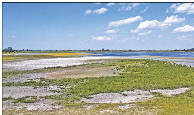
A szikes tavak a Fertőzugban évente többször is változtatják arcukat.

A nemzeti parknak mind az öt részterülete – így a legtöbb szikes tó is – autóval is elérhető, de a legtöbb dűlőt és gazdasági út csak a kerékpáros és gyalogos turizmus számára áll nyitva. Találhatók ott különböző méretű és eltérő magasságú kilátók,