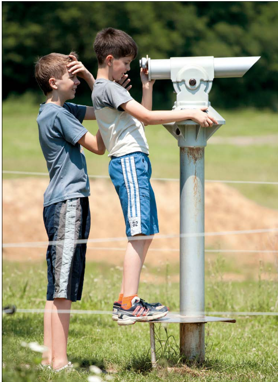
A kíváncsi szemeknek a bivalyrezervátumban is van mit nézniük

– Ez az ország legnagyobb látogatható bivalycsordája. Nyáron az állatok kint vannak a legelőn, ilyenkor pettyezik az egész tájat. Nagyon szép természeti