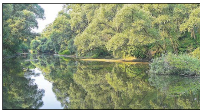
A horvát határ mentén buja árterek között hömpölyög a Mura. (Balaton-felvidéki NPI)

amelyek alkalmasak a hosszabb távú megfigyelésre és/vagy a természetfotózásra. Hogy a különböző évszakokban melyik élőhelyen milyen látnivaló akad, azt az Illmicben található, egész évben nyitva tartó információs központban tudhatják