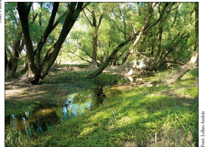
A Mura holtágai élőhelynek és élménynek is különlegesek

Dunáé a Dunakanyarban, ahol az egyik leggyorsabb a folyó, 15 centiméteres.