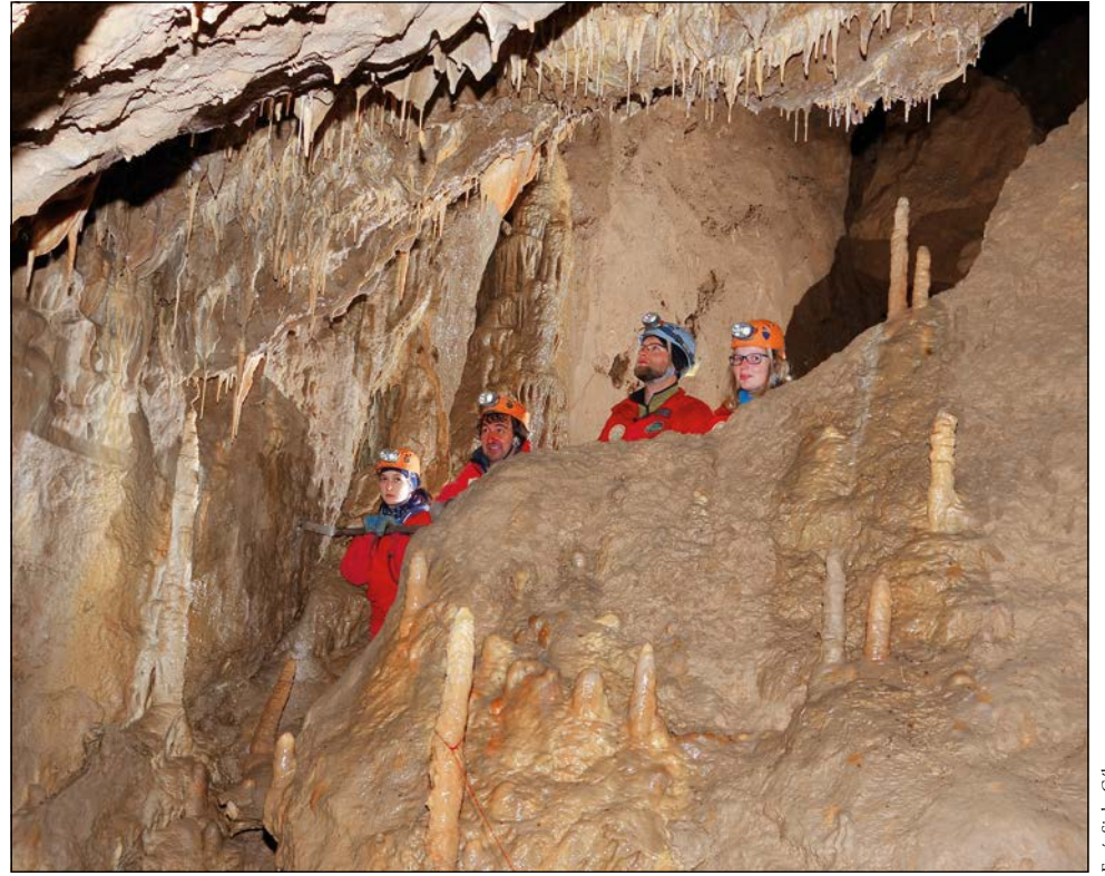
Látogatók a Csodabogyós-barlang Függőkert elnevezésű termében

az égen ilyenkor, háton repülnek, bukfenceznek, egyéb kunsztokat mutatnak egymásnak: én leginkább egy csapat a parkban bulizó, gördeszkás gyerekhez tudom hasonlítani őket. Nem mondhatok mást: ezek a madarak ilyenkor játszanak, mert a tevékenységnek semmi praktikus haszna nincs: nem a párválasztás, nem a territórium védelme, nem a táplálékszerzés mozgatja őket. Egyszerűen jól érzik magukat együtt. Pedig sokan gondolják, hogy az ilyesfajta időtöltés csak az ember sajátja. A kutatások is számos bizonyítékát szolgáltatják már a hollók kivételes intelligenciájának. Én biztos vagyok benne, hogy van valóságalapja a Mátyás király legenda egyik elemének,