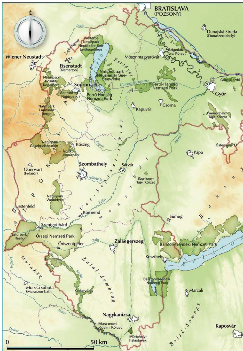
Folyók, szikes tavak, erdők, füves puszták, legelők, lápok és vulkánhegyek, mindezen élőhelyek, ökoszisztémák megtalálhatók a PaNaNet régióban a Dunától a Muráig.

• A „Miénk itt e ré!” című határon átnyúló diáknapi napokat 2017. május 5–6-án és 2018. május 11–12-én rendezték meg Kőszegen. A játékos versenyben 2017-ben először vettek részt burgenlandi diákok is, ahol újszerű élményeken keresztül ismerkedhettek meg a PaNaNet területek állat- és növényvilágával.