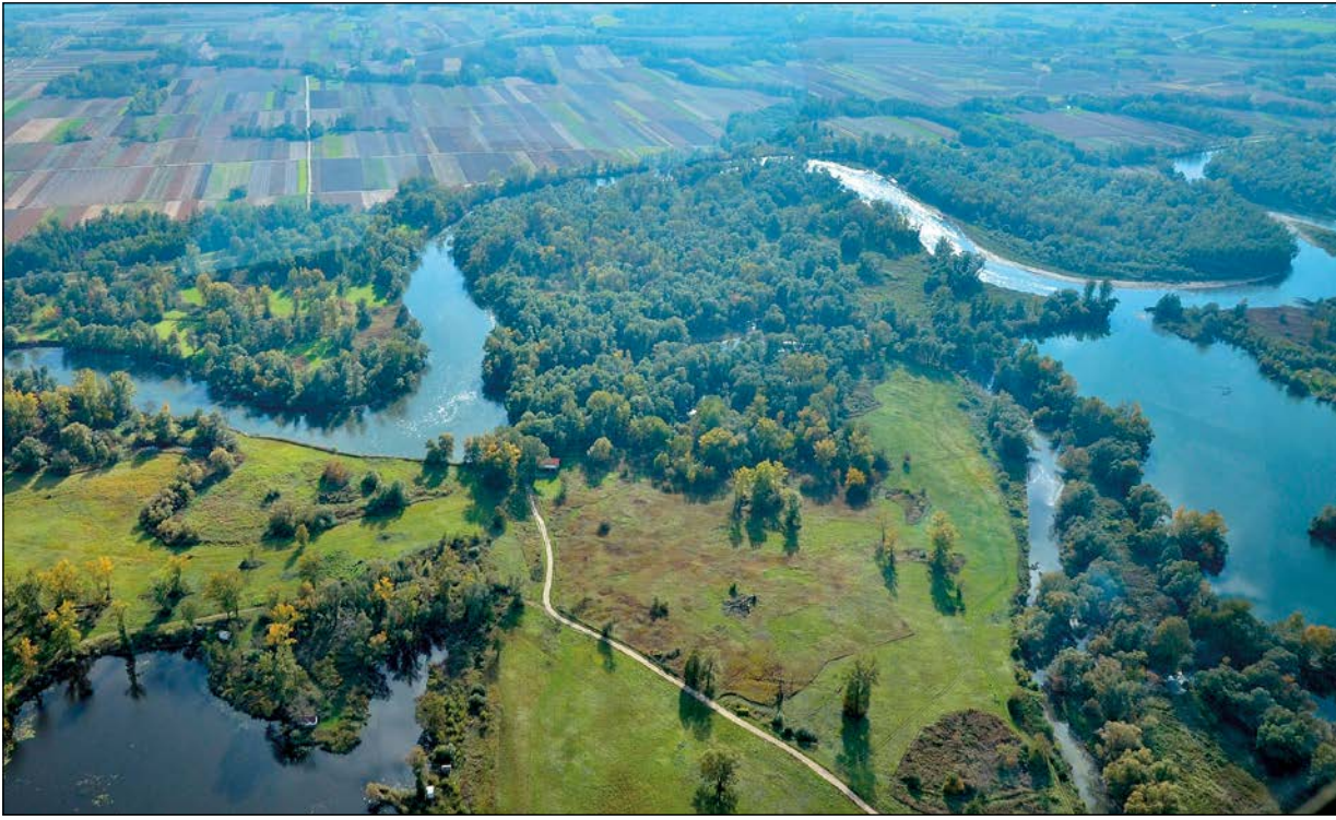
A Mura madártávlatból. Mindig hasznos egy másik nézőpont, hogy az ember rádöbbenjen, milyen csodálatos helyen él