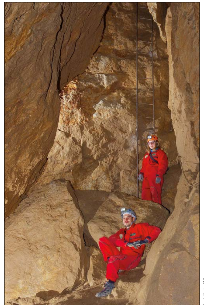
A földtörténeti múlt tárul fel a mélyben

Az alap túra hossza 400 méter, és 1,5-2 óra alatt teljesíthető, az extrém 1 vendégei 900, az extrém 2 résztvevői pedig 1000 métert tesznek meg a föld alatt. Utóbbi során érik el a látogatók a barlang bejárható részének mélypontját: a Világító Kérdőjel Mauzóleuma-terem a bejáratától csaknem 90 méteres mélységben található. De ez a túra vezet el a barlang legnagyobb „helyiségebe”, a Bál-terembe is, illetve érinti az izgalmas nevet viselő Gyönyörök-termet is. Az alap túra bármely hétköznapi embernek biztonságosan ajánlható, de a másik két