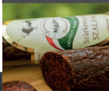
szürkemarha és bivaly szalámi