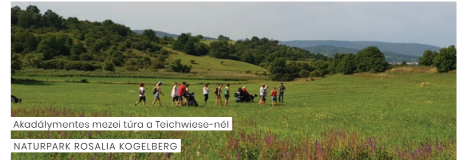
Akadálymentes mezei túra a Teichwiese-nél NATURPARK ROSALIA KOGELBERG

Nálunk a természet nem ismer akadályokat!