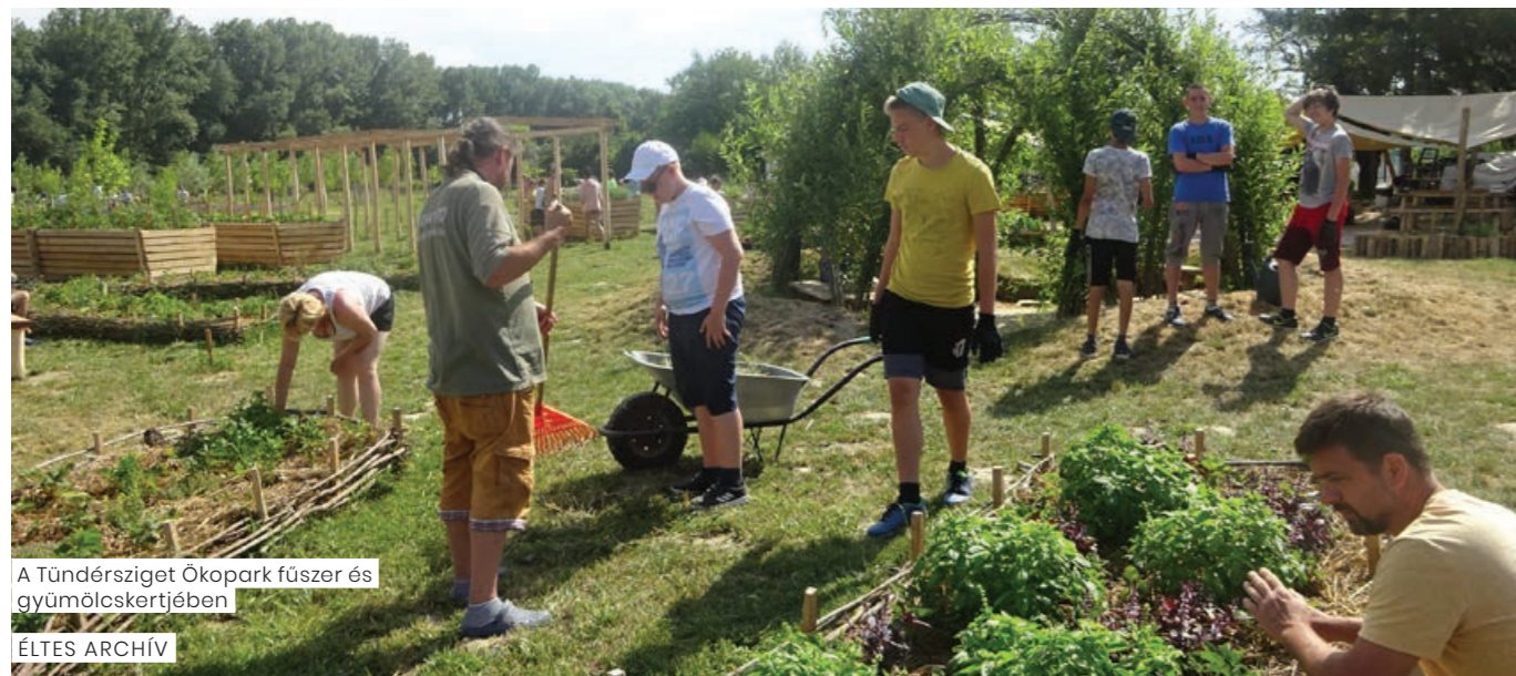
A Tündérsziget Ökopark fűszer és gyümölcskertjében

A PaNaNet projekt szélesre tárta a világot a mosonmagyóvári diákok számára – az Éltes Mátyás EGYMI 2009 óta együttműködik a dunaszigeti Ökoparkkal, 2017-től az osztrák – magyar határtérség védett területeinek, natúr és nemzeti parkjainak együttműködő partnere. A közös munkáról, valamint az elmúlt évek eredményeiről is beszámolunk.