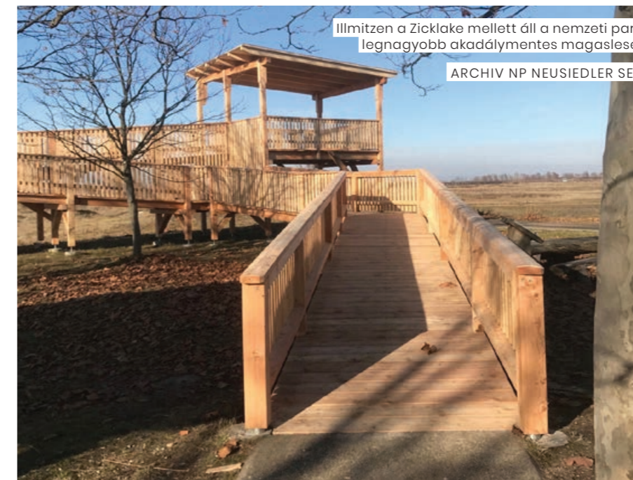
Illmitzen a Zicklake mellett áll a nemzeti park legnagyobb akadálymentes magaslese