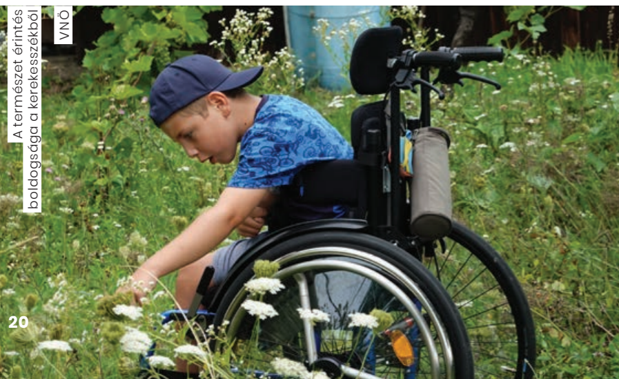
A természet érintés boldogsága a kerekesszékből VNÖ