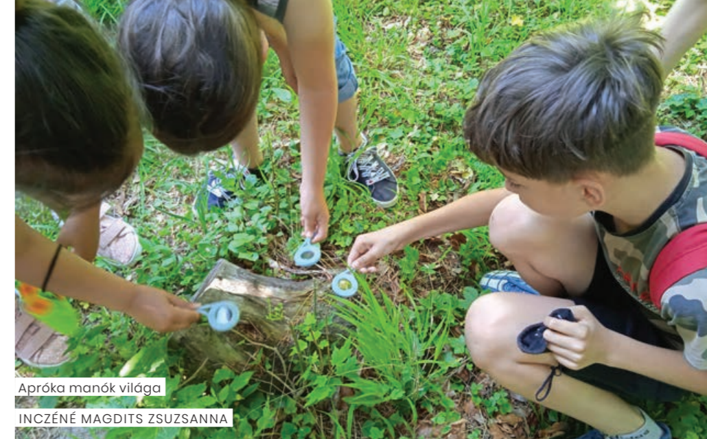
Apróka manók világa INCZÉNÉ MAGDITS ZSUZSANNA

A „Csodaszarvas” program napközis táborra jó lehetőséget nyújt számunkra: a jól megválasztott témamodulnak köszönhetően tágabb környezetünket, annak értékeit, szépségét is megismerhették a gyerekek. Pozitív tapasztalatokat szereztünk középiskolás fiatalok közösségi szolgálati munkájáról is. A lelkes fiatalok felnőtteket megszegyenítő érzékenységgel fordultak a fogyatékkal élő gyerekek felé.