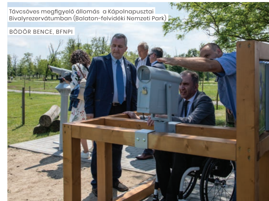
Távcsöves megfigyelő állomás a Kápolnapusztai Bivalyrezervátumban (Balaton-felvidéki Nemzeti Park)