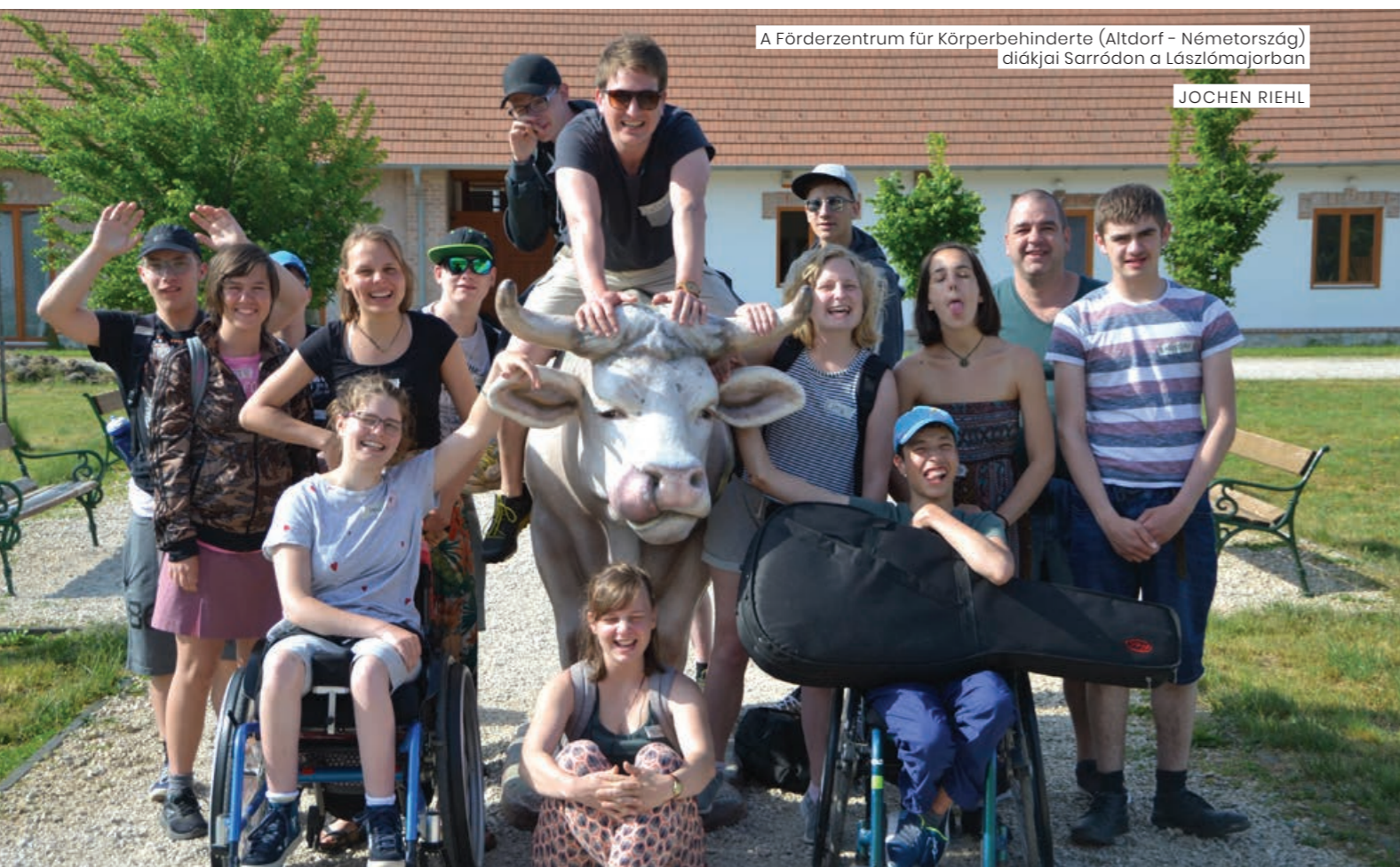
A Förderzentrum für Körperbehinderte (Altdorf – Németország) diákjai Sarródon a Lászlómajorban