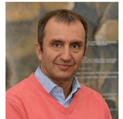
Szekeres Pál, a fogyatékos emberek társadalmi integrációjával kapcsolatos feladatok ellátásáért felelős miniszteri biztos Emberi Erőforrások Minisztériuma