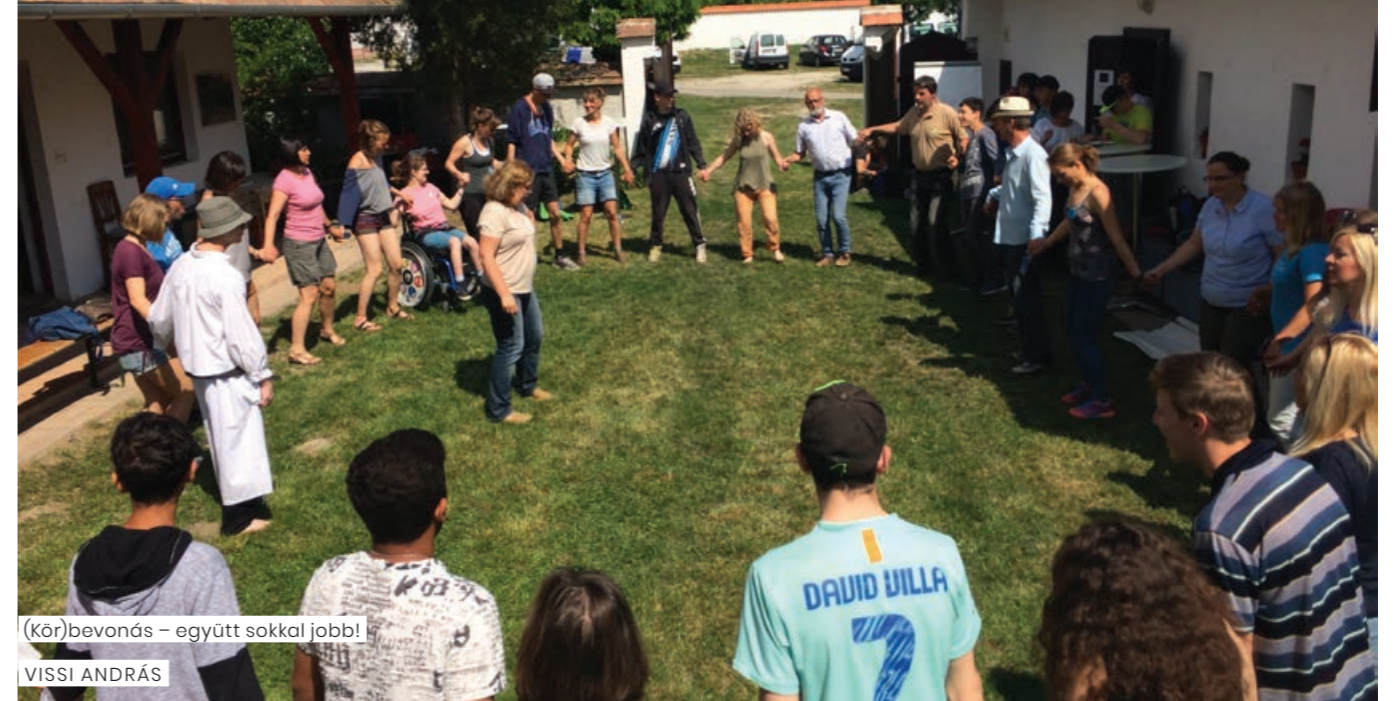
(Kör)bevonás – együtt sokkal jobb!

A mindennapos iskolai életet is áthatja a fentebb említett szemléletformáló munka. Az osztályok tanulói részt vesznek jeles napjaink megünneplésében, valamint témahetekben. Ezekben különböző alkotásokat készítenek, illetve feladatokat oldanak meg az adott témával kapcsolatban. Ilyen jeles napjaink például a Föld napja, a Kenyér világnapja, a Madarak és Fák napja, a Víz világnapja és az Állatok Világnapja.