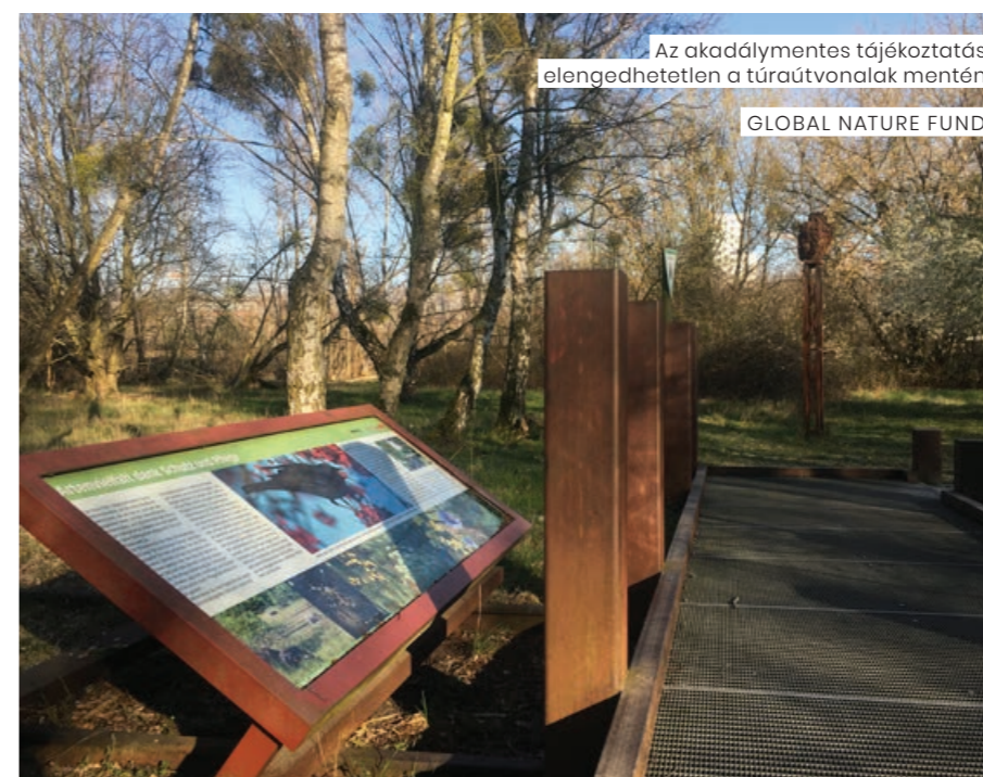
Az akadálymentes tájékoztatás elengedhetetlen a túraútvonalak mentén