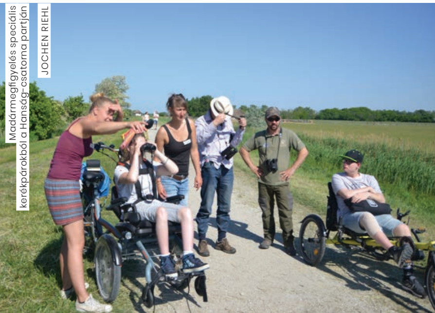
Madármegfigyelés speciális kerékpárokkal a Hanság-csatorna partján