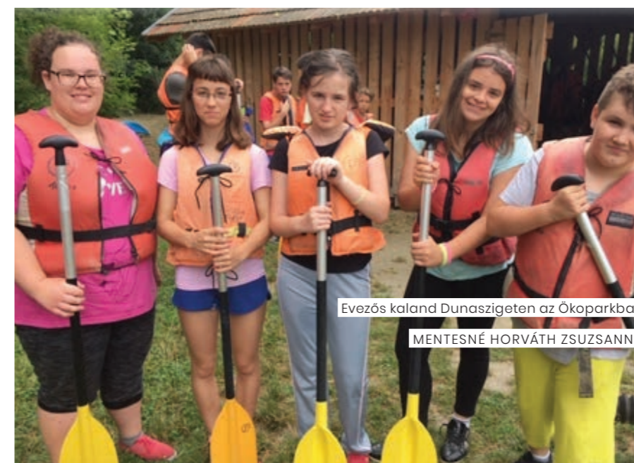
Evezős kaland Dunaszigeten az Ökoparkban