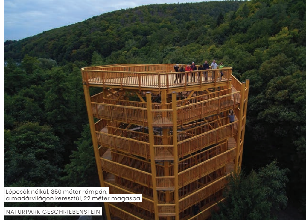
Lépcsők nélkül, 350 méter rámpán, a madárvilágon keresztül, 22 méter magasba NATURPARK GESCHRIEBENSTEIN

A torony belsejében kialakított röpdében különböző madárfajokat figyelhetünk meg utunk során. A madárház olyan sérült madaraknak ad otthont, amelyeknek a vadonban már nem lenne esélyük a túlélésre. Az állatok jólétéről a Bécsi Állatorvosi Egyetem támogatásával gondoskodnak.