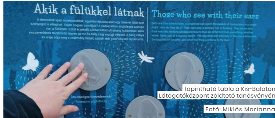
Tapintható tábla a Kis-Balaton Látogatóközpont zöldtető tanösvényén

A Bivalyrezervátum akadálymentesítési szempontoknak megfelelő korszerűsítésére a PaNaNet+ projekt keretében nyílt lehetőség. A 2021-ben lezárult fejlesztést a tervezéstől a kivitelezésig akadálymentesítési szakértő segítette. A bejárat közelében akadálymentes parkolóhely létesült, új recepció és büfépultot alakítottak ki akadálymentes pulpszakasszal és beépített indukciós hurokkal. A kiállítóteremben audio nyomógombos és hangbúrával ellátott installáció segíti a Kis-Balaton márdárvilágának megismerését. A tapogatható, stílizált állatmodellek által a látásukban korlátozott látogatók is megismerhetik a Bivalyrezervátum állatvilágának jellegze-