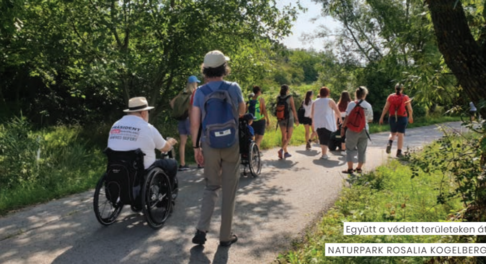
Együtt a védett területeken át NATURPARK ROSALIA KOGELBERG

valamint a Fogytékkel Élők Burgenlandi Szövetségét (ÖZIV). Ez az együttműködés azt is magában foglalta, hogy 2020 júniusában mind a 11 természeti élmény- és pihenőállomást, valamint a Teichwiesen körtúrát az ÖZIV - ismételt ellenőrzést követően - hivatalosan is akadálymentesnek minősítette.