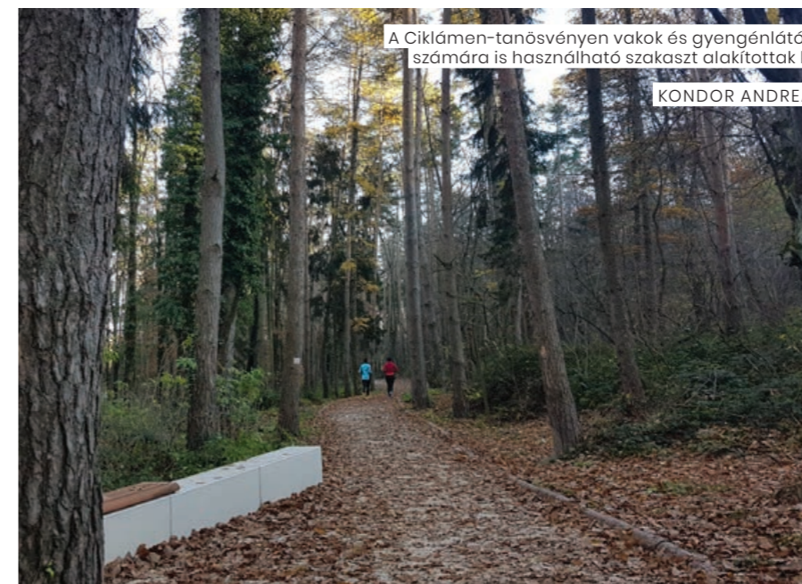
A Ciklámen-tanösvényen vakok és gyengénlátók számára is használható szakaszt alakítottak ki