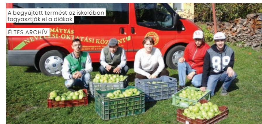
A begyűjtött termést az iskolában fogyasztják el a diákok

A PaNaNet projekt szélesre tárta a világot tanítványaink és oktatóink számára, például a nemzeti parkokban, tájházakban tett látogatások révén. A projekt keretein belül több programon vettünk részt, amelyek élményt és új ismereteket adtak a gyerekeknek. Ugyanakkor nagyon tanulságosak voltak számunkra, gyógypedagógusok számára is. Az egyik legfontosabb kérdésnek azt tartottuk, hogyan tudjuk akadálymentessé tenni a természetjárást, hogyan tudjuk érthetővé, befogadhatóvá tenni az ismereteket, hogyan tudunk olyan cselekvésbe ágyazott tapasztalatokat nyújtani nekik, amelyek befogadását fogyatékoságuk nem korlátozza. Részt vettünk a nemzeti parkoknak a gyógypedagógusok és környezeti nevelők számára tar-