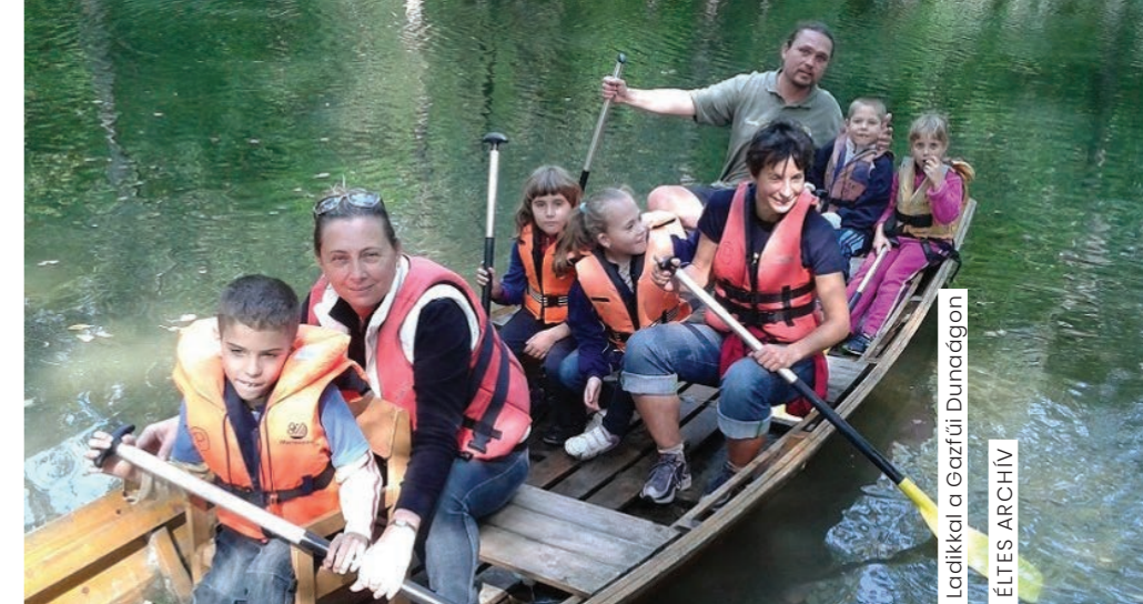
Ladikkal a Gazfűi Dunaágon