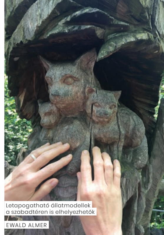
Letapogatható állatmodellek a szabadtéren is elhelyezhetők

A túraútvonalak és bemutatóhelyek akadálymentesítésére nem lehet általános, mindenki számára megfelelő megoldásokat ajánlani. A fogyatékossgal élőknek speciális igényei és szükségletei vannak. Minden egyes fogyatékossgal nagyon sokféle és nagyon egyéni. Ráadásul, ha valaki két vagy több fogyatékossgal él (például siketvakok), akkor még nehezebb számára