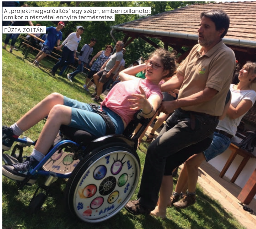
A „projektmegvalósítás” egy szép-, emberi pillanata: amikor a részvétel ennyire természetes

A vendégeid/diákjaid/tanítványaid elhagyják a komfortzónájukat, és belépnek egy