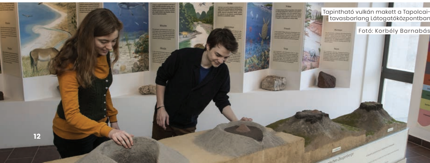
Tapintható vulkán makett a Tapolcai-tavasbarlang Látogatóközpontban

A 2020-ban megnyílt Kis-Balaton Látogatóközpont elsődleges célja a fokozottan védett Kis-Balaton természeti értékeinek közvetítése. A közel 1000 négyzetméteres bemutatóhely egy GINOP projekt támogatásával készült el. A látogatóközpont bejárata előtt 2 mozgássérült parkolót is kialakítottak. Az épület tervezésénél fontos szempont volt, hogy a teljes járószint egy síkban legyen, szintkülönbség (pince, emelet) ne nehezítse a bejárhatóságot. A bemutatóhely állandó kiállítása számos helyen tartalmaz a fogyatékkal élő emberek számára olyan elemeket/megoldásokat, amelyek megkönnyítik a tárlat befogadását. A mozi terem például kerekesszékekkel érkező látogatók fogadására is alkalmas. A kiállítás audiovizuális tartalmának egy része fejhallgatóval használható. A természet állatvilágának hangjai hangbúrák alatt hallhatók, amelyek kerekesszékekkel is meg lehet közelíteni. A kiállításnak van olyan filmnyelve, amely nem-