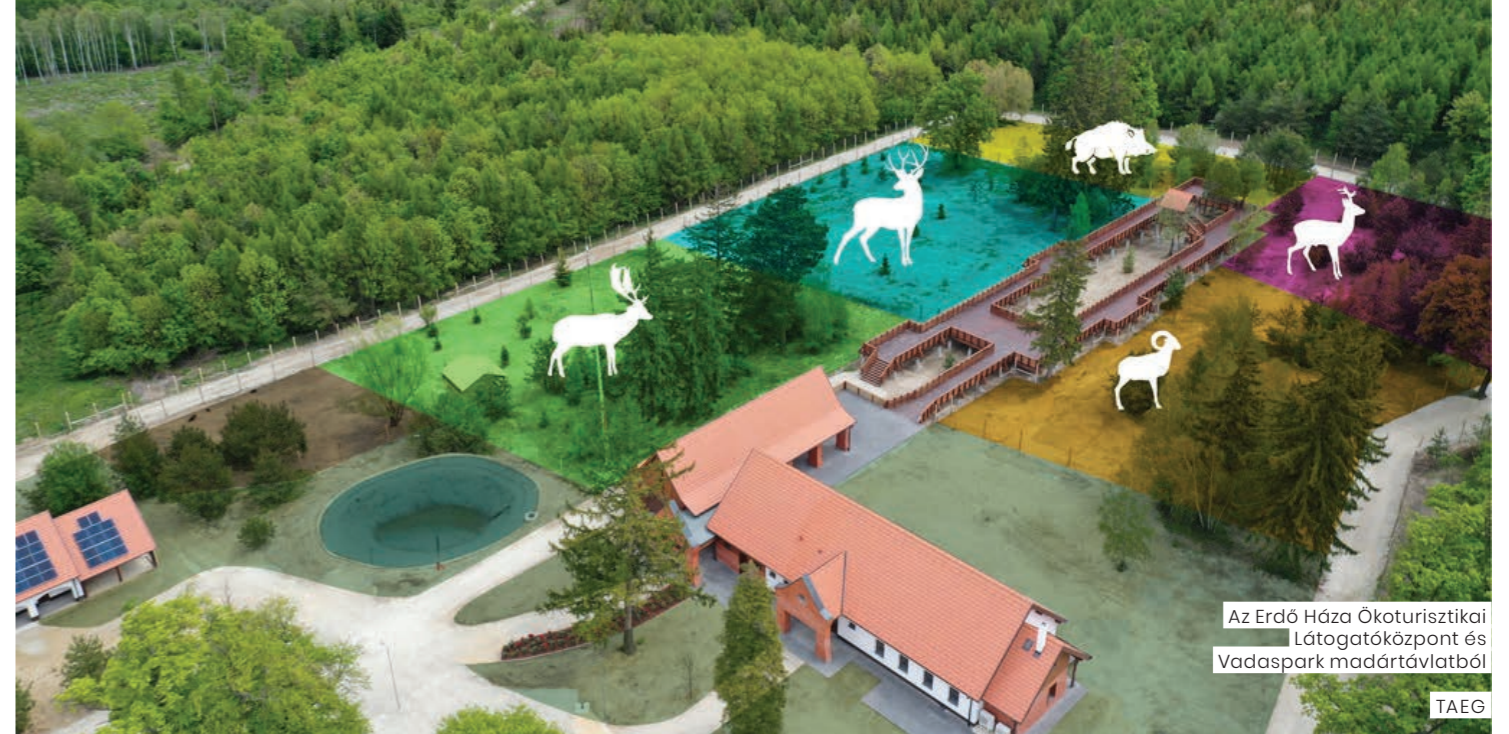
Az Erdő Háza Ökoturisztikai Látogatóközpont és Vadaspark madártávlatból

A 2017 Év Ökoturisztikai Látogatóközpontja címmel kitüntetett centrum területén és botanikus kertjében a táj jellegzetes fa, cserje és lágyszárú fajai várják az érdeklődőket. Mivel a környező erdőkben élő vadfajok ritkán kerülnek a látogatók szemé elé, ezért a kiállítás összeállításánál főként a preparátumok bemutatására törekedtek. A Kőhalm Vadászati Múzeum földszintje akadálymentesen megközelíthető. Az itt lévő erdei büfé mellett elsősorban a gyerekeket célzó interaktív látlat látható a parkerdő állat- és növényvilágáról. A felső emelet a vadászaté: itt látogatható a Kőhalm hagyaték. A kiállítás összeállításánál arra törekedtek, hogy ne csak szakmai, hanem emberi is legyen, ezt a célt erősítik a professzor személyes tárgyai, bútorai is, amelyek a család ajándékai.