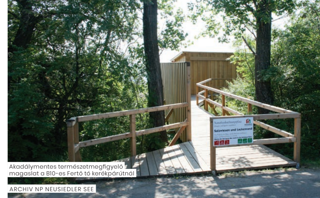
Akadálymentes természetmegfigyelő magasztat a B10-es Fertő tó kerékpárútnál