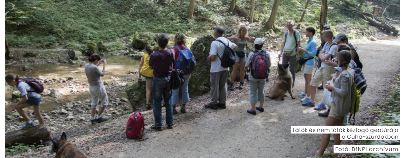
Látók és nem látók kézfogó geotúrája a Cuha-szurdokban