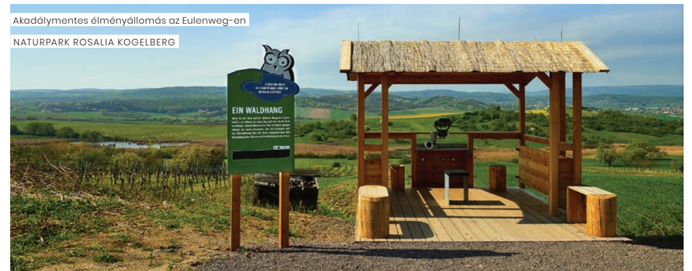
Akadálymentes élményállomás az Eulenweg-en NATURPARK ROSALIA KOGELBERG

A natúrpark az akadálymentes élményállomások tervezésében, majd a kidolgozásában és megvalósításában is bevonta az egyes fogyatékkal élő célcsoportok képviselőit, így a Vakok és Gyengénlátók Bécsi, Alsó-Ausztriai és Burgenlandi Szövetségét,