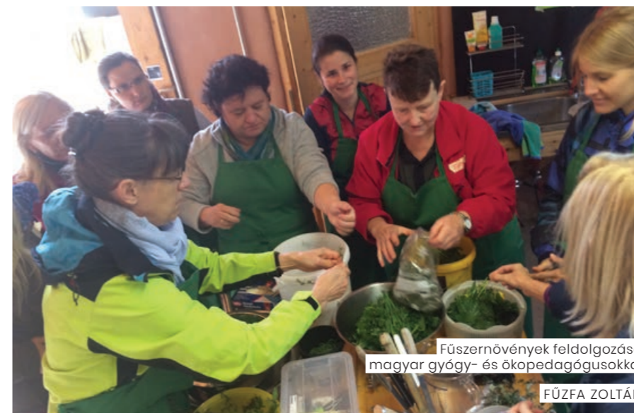
Fűszernövények feldolgozása magyar gyógy- és ököpedagógusokkal

Akadálymentesség: A természet nem kerekesszékek közlekedők számára készült, így a kreativitásukat és a csapatszellemüket sokszor kihívás elé állítja. Mindig legyen kéznél egy heveder, hogy szükség esetén együtt segíthessenek a társukon.