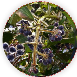
Hedera helix – közönséges borostyán