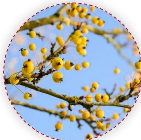
Malus toringo - díszalma