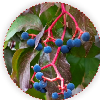
Parthenocissus sp. – vadszőlő fajok