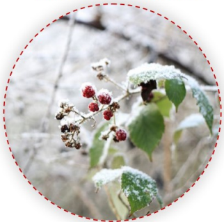
Rubus fruticosus - vadszeder