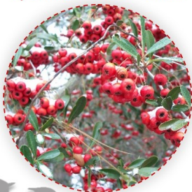
Pyracantha coccinea - tűztövis