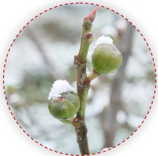
Ficus carica – közönséges füge