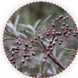
Sambucus nigra - fekete bodza