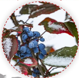
Mahonia aquifolium – közönséges mahónia