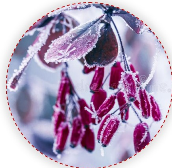
Berberis sp. – borbolya fajok