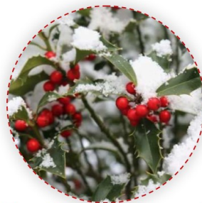
Ilex aquifolium – közönséges magyal