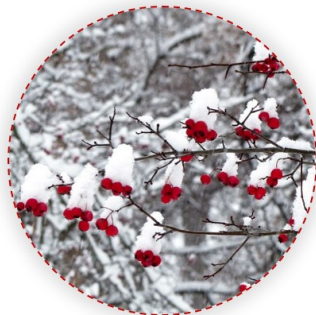
Crataegus sp. – galagonya fajok