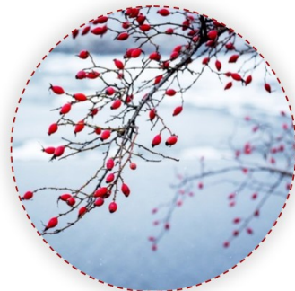
Rosa canina - vadrózsa