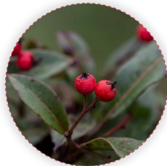
Photinia x fraseri - korallberkenye